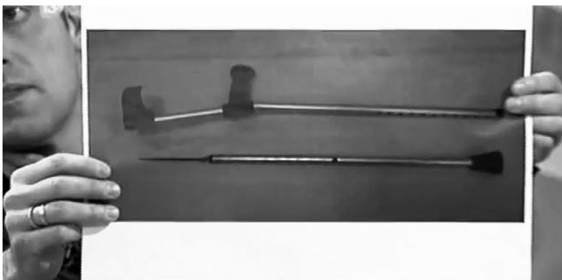
El portavoz de la CEP muestra en 13TV una imagen de la muleta

Un capítulo aparte merecen las armas de los/as manifestantes. Muletas asesinas titulaba el panfleto ABC y nos explicaba que “Entre el material encontrado en la zona de los disturbios figuraban unas muletas a modo de objeto punzante. Un arma, sin lugar a dudas, criminal”. Todos los medios se hicieron eco de la noticia difundida hasta la saciedad por los sindicatos policiales. Lástima que el día anterior a las marchas, Europa Press publicara que esas muletas habían sido detectadas en los Juzgados de Plaza de Castilla y que eran completamente ajenas a la manifestación, porque la historia del nuevo Cojo Manteca armado con las muletas asesinas prometía.